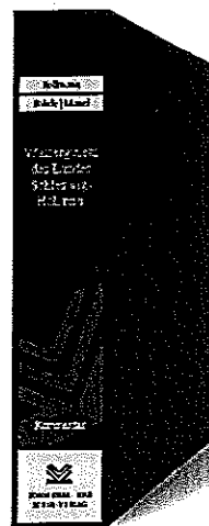
Kommentar Stand 2011 Loseblattausgabe 740 Seiten Format 16,5 x 23,5 cm 68,- EUR ISBN 978-3-88061-775-9